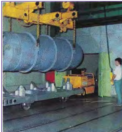
2 - Manutention d'un conteneur de soutirage