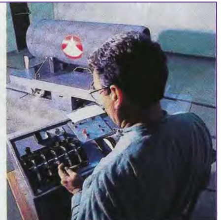
3 - Pesée d'un conteneur « client » rempli d'U enrichi