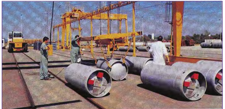
4 - Dernière manutention pour mise à disposition du client de conteneurs d'U enrichi