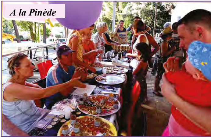
A la Pinède