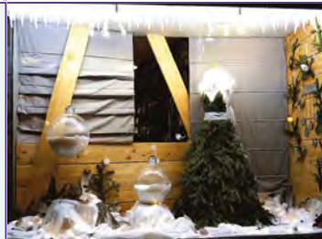
Ets Sportonic, Av Pasteur 1er Prix : Décoration

Malgré les difficultés présentes, nous souhaitons que ce moment de fête apporte, poésie, beauté, gaîté, fantaisie.