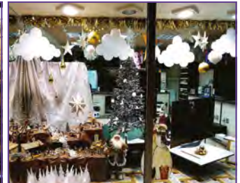
Ets Sotélec, Bd. Victor Hugo 1er Prix : Originalité