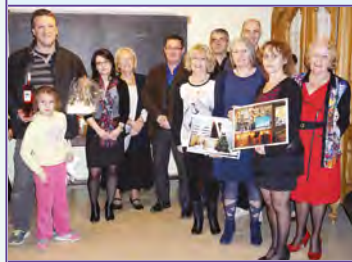
La remise des prix aux lauréats dans les locaux de Parlaren