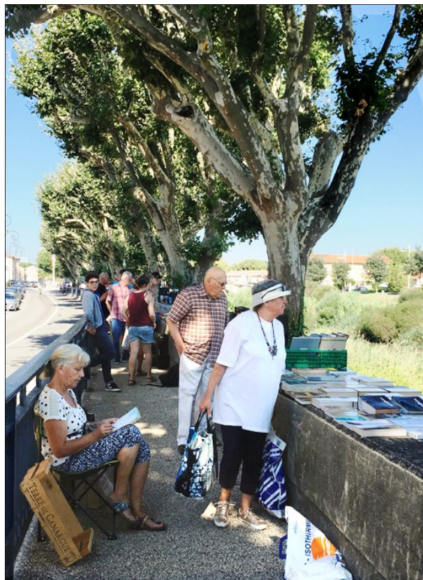
SORTIES DECOUVERTES DU PARIMOINE « GRATUITES » (Devant la CHAPELLE de BAUZON)