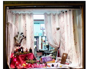
Ets Brunel Rue Emile Zola 1 er Prix : Originalité