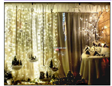
Ets Sportonic Av Pasteur 1 er Prix : Effets de Lumière