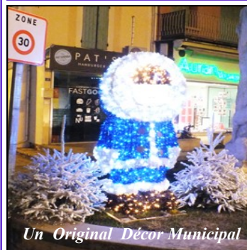
Un Original Décor Municipal