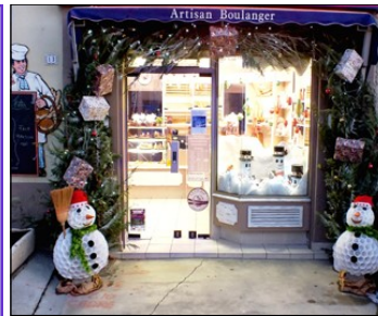
Le Pain Doré. Av Pasteur 1 er Prix : Efforts de Décoration

A nouveau, tous les commerçants du centre ville sont invités à participer au concours de vitrines organisé par le Syndicat d'Initiative à partir du 08/12/18 au 05 Janvier 2019 . Les modalités seront précisées, lors de leur visite, par les bénévoles du S.Initiative . ainsi que par voie de presse. Nous souhaitons que ce moment de fête vous apporte, poésie, beauté, gaîté, fantaisie, Plaisir des yeux Joyeuses Fêtes