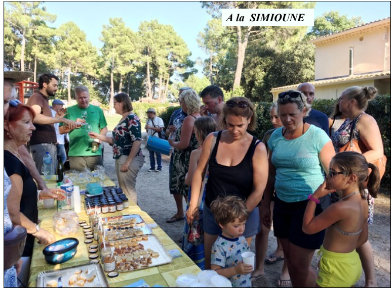
A la SIMIOUNE