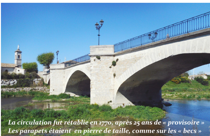
La circulation fut rétablie en 1770, après 25 ans de « provisoire » Les parapets étaient en pierre de taille, comme sur les « becs »

On ne fit rien jusqu'en 1764 , époque où le vice-légat G. Salviati, sollicité par les consuls, vint à Bollène, accompagné des ingénieurs du Comtat, messieurs Boissin et Estève. L'examen des lieux confirma la nécessité de refaire non-seulement l'arche, mais le pont en entier , car si l'arche de la chapelle s'était ouverte, les trois autres avaient souffert, et l'avant-bec de celle du milieu s'était détaché de la construction : un rapport fut dressé concluant à la réfection totale.