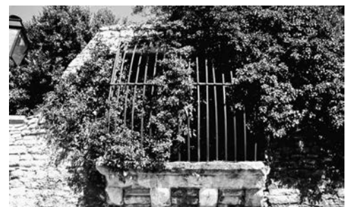
Le fossé humide longeait le rempart dont il reste ce magnifique témoignage Bard Gambetta.

En examinant le tracé, il semble probable qu'une pelle de dérivation, en attente à l'angle Sud-est de la Mairie, soit utilisée pour une mise en eau assurant le remplissage et le maintien à niveau, avec l'aide des eaux de la Montée de la Glacière, du fossé humide partant de la Porte Neuve et aboutissant à la Porte du Moulin.