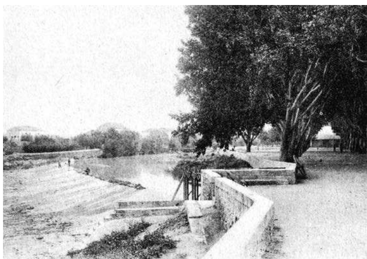
Le barrage dit «de L'Écluse » et les vannes de la prise d'eau du Béal des Miailles. Au fond la passerelle détruite en 1993 qui avait remplacé celle emportée en 1914