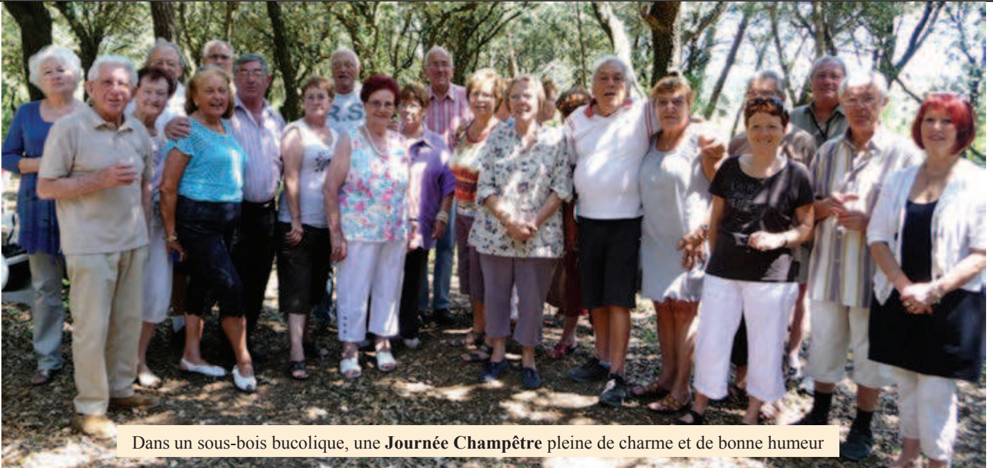
Dans un sous-bois bucolique, une Journée Champêtre pleine de charme et de bonne humeur

Randonnées pédestres : évasion au cœur de la nature, paysages somptueux ou villages classés .