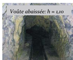
Voûte abaissée: h = 1,10