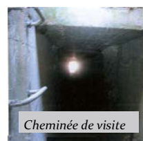
Cheminée de visite