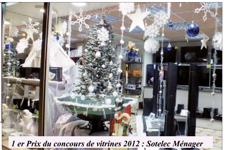
1er Prix du concours de vitrines 2012 : Sotelec Ménager