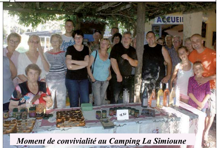
Moment de convivialité au Camping La Simioune