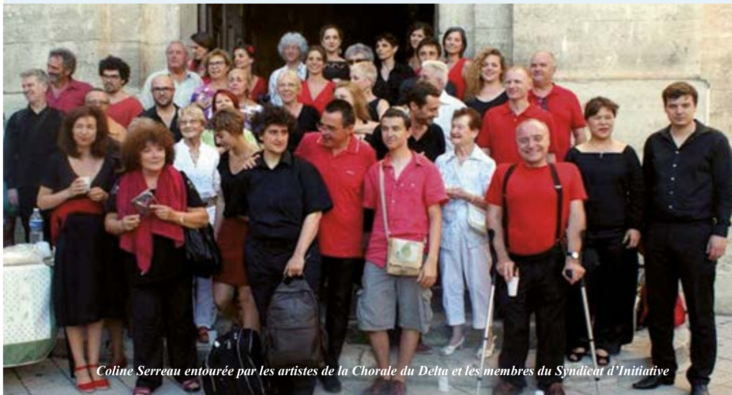
Coline Serreau entourée par les artistes de la Chorale du Delta et les membres du Syndicat d'Initiative

Beaucoup de convivialité dans les accueils de bienvenue dans les campings, des randonnées découvertes toujours aussi appréciées, des dimanches matins au bord du Lez devenant des rencontres culturelles et amicales, un concert inoubliable dans la belle église de Mondragon et quelques visites historiques accompagnées pour raconter notre ville. Avec l'hiver et les fêtes de Noël, nous incitons les commerçants à décorer leur vitrine pour que notre ville soit belle et lumineuse, et les bollénois à venir les admirer.