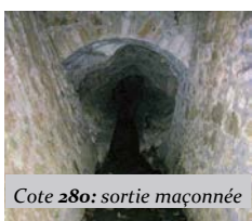
Cote 280: sortie maçonnée