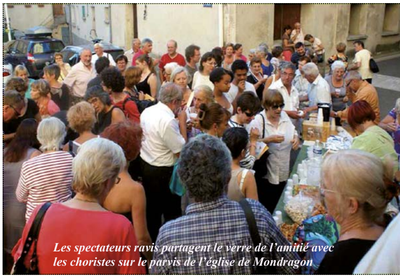
Les spectateurs ravis partagent le verre de l'amitié avec les choristes sur le parvis de l'église de Mondragon